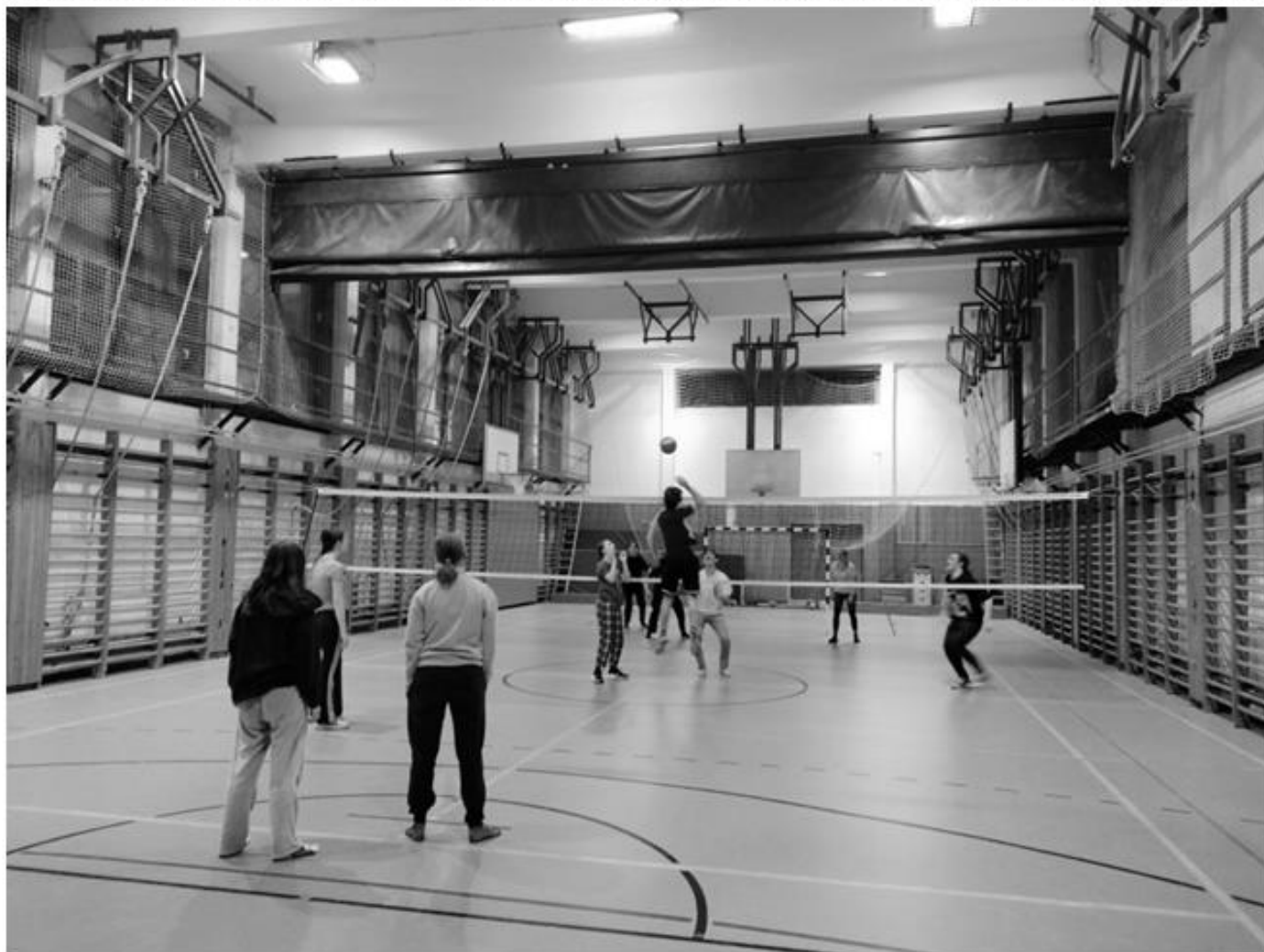
Röplabdamezőzés a bentelváson 2024. decemberben

I. ÉVFOLYAM 1. SZÁM – ÓBUDAI GIMNÁZIUM DIÁKÖNKORMÁNYZATA